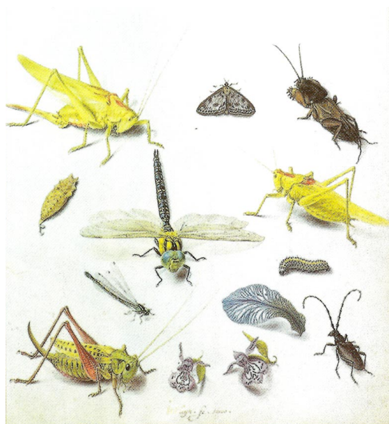
Jaques de Gheyn II, Insecten en bloemen , 1600. Met Blauwe glazenmaker. aquarel en gouache op perkament, 22,7 X 17,5 cm. Collection Frits Lugt, Institut Néerlandais, Parijs

© KUNSTSCHRIFT I/2008. over de kleinste dieren