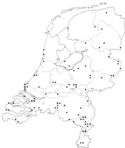
Verspreiding 1990-1997 (cirkel), 1998-2007 (stip). Distribution 1990-1997 (circle), 1998-2007 (dot).