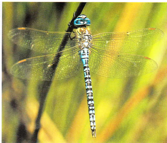
Zuidelijke glazenmaker Aeshna affinis .