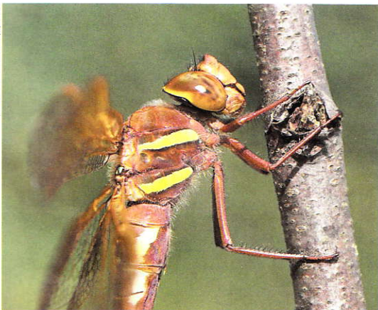
Bruine glazenmaker Aeshna grandis .