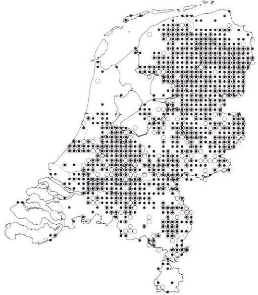
Verspreiding 1990-1997 (cirkel), 1998-2007 (stip). Distribution 1990-1997 (circle), 1998-2007 (dot).

De Bruine glazenmaker is algemeen in het noorden en midden van Nederland. De soort is in West-Nederland zeer schaars. In Zuid-Nederland is de soort eveneens schaars en daar lijkt na 1997 sprake te zijn van een achteruitgang. De soort komt vooral voor in Midden- en Noord-Europa en bereikt in Nederland haar zuidgrens. Zowel in de Flevopolder als ten westen en noorden van Amsterdam zijn er relatief veel recente waarnemingen. Mogelijk ligt dit aan een toegenomen inventarisatie-inspanning, maar alternatieve verklaringen zijn de verzoeting van het water in delen van Noord-Holland en de toename van geschikt habitat in de Flevopolder.