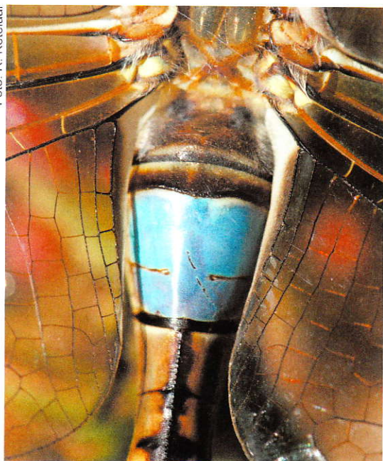
Het zadel van de Zadellibel Anax ephippiger .