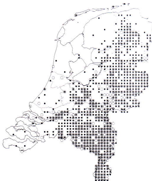
Verspreiding 1990-1997 (cirkel), 1998-2007 (stip). Distribution 1990-1997 (circle), 1998-2007 (dot).