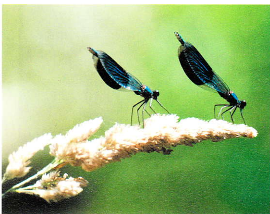
Weidebeekjuffer Calopteryx splendens mannetjes.