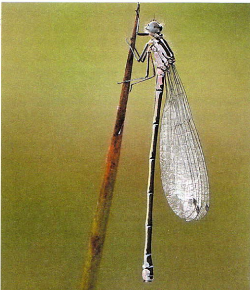
Variabele waterjuffer Coenagrion pulchellum .