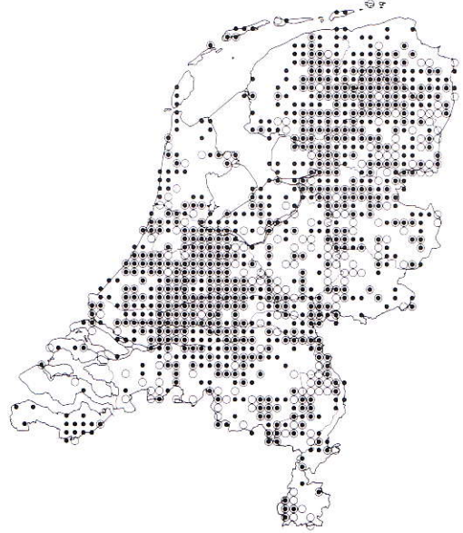
Verspreiding 1990-1997 (cirkel), 1998-2007 (stip). Distribution 1990-1997 (circle), 1998-2007 (dot).