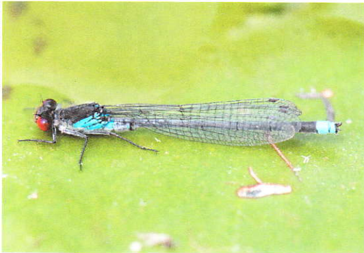
Man Grote roodoogjuffer Erythromma najas .