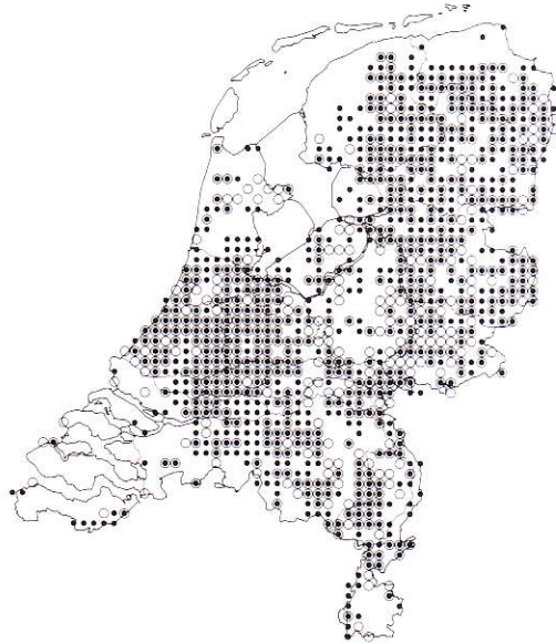
Verspreiding 1990-1997 (cirkel), 1998-2007 (stip). Distribution 1990-1997 (circle), 1998-2007 (dot).

De Grote roodoogjuffer verschijnt begin mei en heeft vrij snel zijn piek half mei tot half juni. Daarna nemen de aantallen geleidelijk af, maar de soort kan tot in september worden waargenomen.