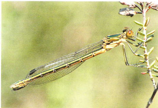
Tangpantserjuffer Lestes dryas , vrouw.