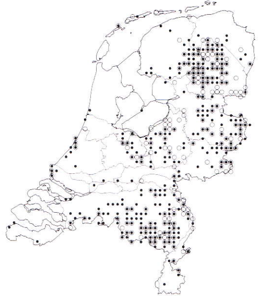
Verspreiding 1990-1997 (cirkel), 1998-2007 (stip). Distribution 1990-1997 (circle), 1998-2007 (dot).