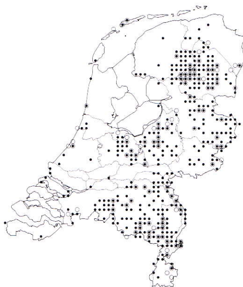
Verspreiding 1990-1997 (cirkel), 1998-2007 (stip). Distribution 1990-1997 (circle), 1998-2007 (dot).