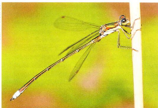
Tengere pantserjuffer Lestes virens , man.