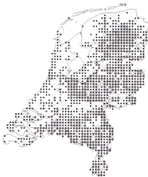
Verspreiding 1990-1997 (cirkel), 1998-2007 (stip). Distribution 1990-1997 (circle), 1998-2007 (dot).