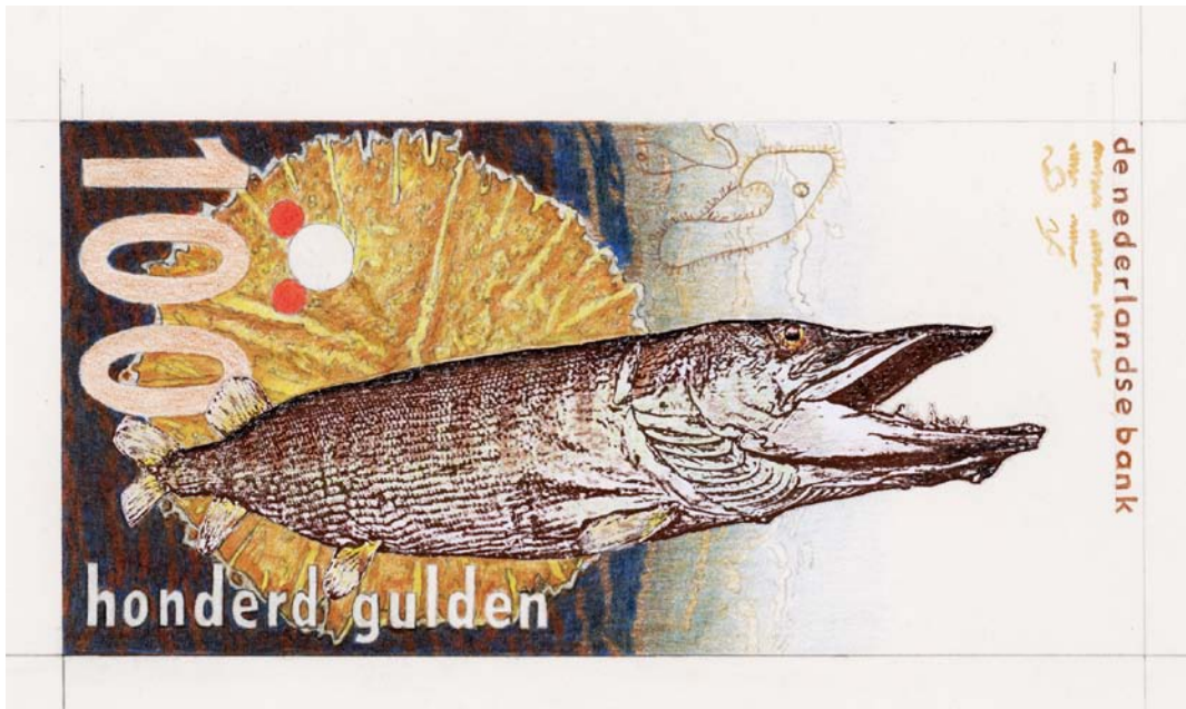
Figuur 2. Op de voorzijde van het ontwerp van het 100 guldenbiljet is een Snoek ( Esox lucius ) afgebeeld. A Northern Pike (Esox lucius) is shown on the front side of the draft design of the 100 gulder banknote designed by Rob Schröder in 1986.