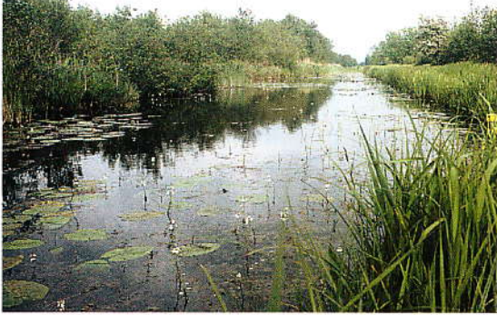
De Kromme Rade in mei: in de voorzomer zijn langs de Kromme Rade de meeste libellensoorten aan te treffen.

in de kade zichtbaar. Aan de zuidzijde van de kade ligt een grote plas, de Vuntus. Het oostelijke deel daarvan bestaat uit verschillende interessante slootjes. Aan de noordzijde van de Kromme Rade loopt een prachtige sloot. Dat hier veel water opkwelt blijkt uit het voorkomen van Waterviolier en ook Krabbenscheer is hier in het heldere water veel te vinden. Deze sloot ligt aan de zuidkant van 'het Hol', het mooiste en best bewaarde onderdeel van de Vechtplassen. Al jaren is dit een voor het publiek afgesloten gebied, dat beheerd wordt door Natuurmonumenten. Wandelend langs de Kromme Rade is een groot deel van de daar aanwezige soortenrijkdom echter wel te zien. Behalve de laagveenlibellen, die hier soms in grote aantallen aanwezig zijn (zie tabel), maken ook de Gerande oeverspin, de Zwarte stern, de Ringslang en het Kransvederkruid de laagveen-soortenlijst behoorlijk compleet.