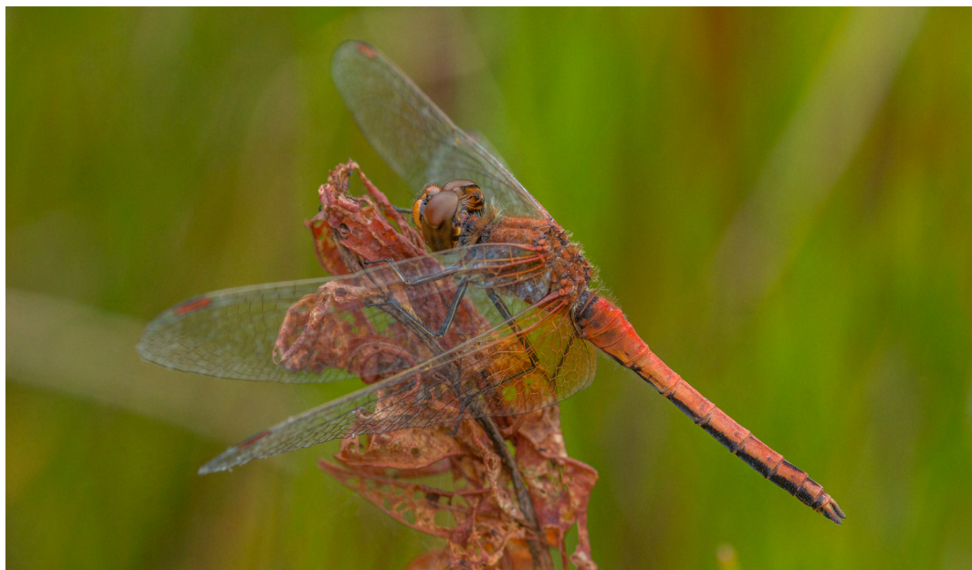
Figuur 1. Een mannetje Geelvlekheidelibel met de kenmerkende vierkante gele vlek in de achtervleugel en de zwarte onderzijde van het achterlijf.

De Geelvlekheidelibel komt voor van Europa tot Japan en is vooral in het oosten van zijn areaal algemeen en op wereldschaal is het absoluut geen bedreigde soort. In West-Europa zitten we aan de grens van het verspreidingsgebied en is het bij uitstek een soort met een invasieachtig voorkomen. In invasiejaren kan ze algemeen zijn, waarna hun aantal in enkele jaren weer afneemt. De laatste decennia was de Geelvlekheidelibel