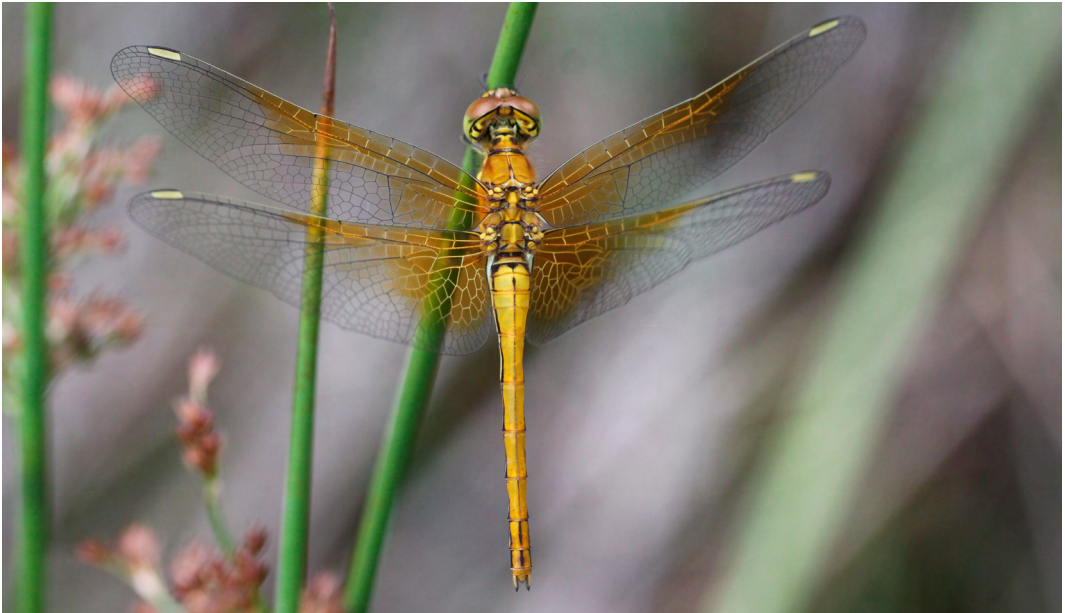
Figuur 3. Een vrouwtje Geelvlekheidelibel. Female of the Yellow-winged Darter (Sympetrum flaveolum).

worden, ze lijken dan weinig kritisch. Maar voor langdurige populaties en grote aantallen zijn ze afhankelijk van zeggen- en holpijpvegetaties, grazige moerassen die 's winters overstromen en 's zomers droog vallen, en van kleine stilstaande wateren, zoals veedrinkpoelen, in landbouwgebied. De hydrologie en het landschap zijn in veel gebieden in Midden- en Oost-Europa echter sterk veranderd de laatste decennia. Door drainage en grondwaterwinning zijn veel moerassen en poelen verdwenen en vallen potentiële habitats te vroeg in het jaar droog. Daarnaast leidt intensivering van de landbouw tot eutrofiëring, resulterend in een verdichting van de vegetatie en ook dan wordt het ongeschikt voor Geelvlekheidelibellen (Bernard et al. 2002). Mogelijk leidt klimaatverandering er ook toe dat poelen en moerassen te vroeg in het jaar opdrogen. Het is dus maar de vraag of de bronpopulaties nog groot genoeg zijn om voor een flinke invasie te kunnen zorgen en zo geschikte gebieden in de Lage landen opnieuw kunnen bevolken. Daarom lijkt het onwaarschijnlijk dat onze Vlaamse en Nederlandse gebieden op korte termijn duurzame populatie van Geelvlekheidelibellen