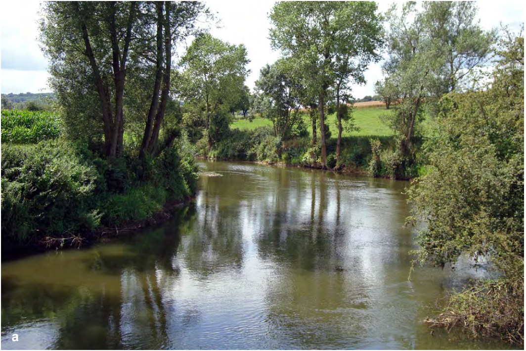
Figuur 3. Leefgebied van de Gele rombout ( Gomphus simillimus ) in noordoost Frankrijk. a: De Chiers te La Ferté-sur-Chiers, 20-07-2009 – b de Aisne te Asfeld, 2-07-2010.