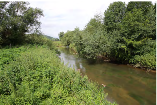
Figuur 2. De grensrivier de Chiers te Torgny (België) – Velosnes (Frankrijk), vindplaats van de Gele rombout ( Gomphus simillimus ), 5-08-2017. Kenmerkend voor de Chiers is hier de afwisseling tussen een zandige bodem, de aanwezigheid van kiezelstenen en plaatselijk afzetting van een sliblaag.