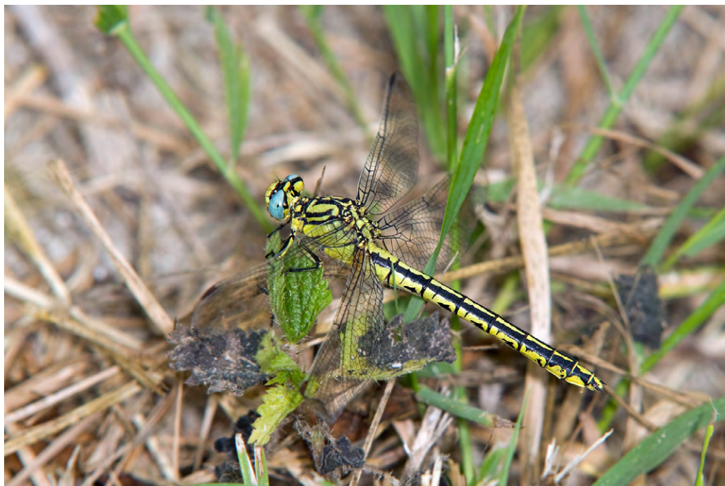
Figuur 1. Vrouwkje Gele rombout ( Gomphus simillimus ), Asfeld, Frankrijk, 3-07-2010.

De meest noordelijke waarnemingen van de